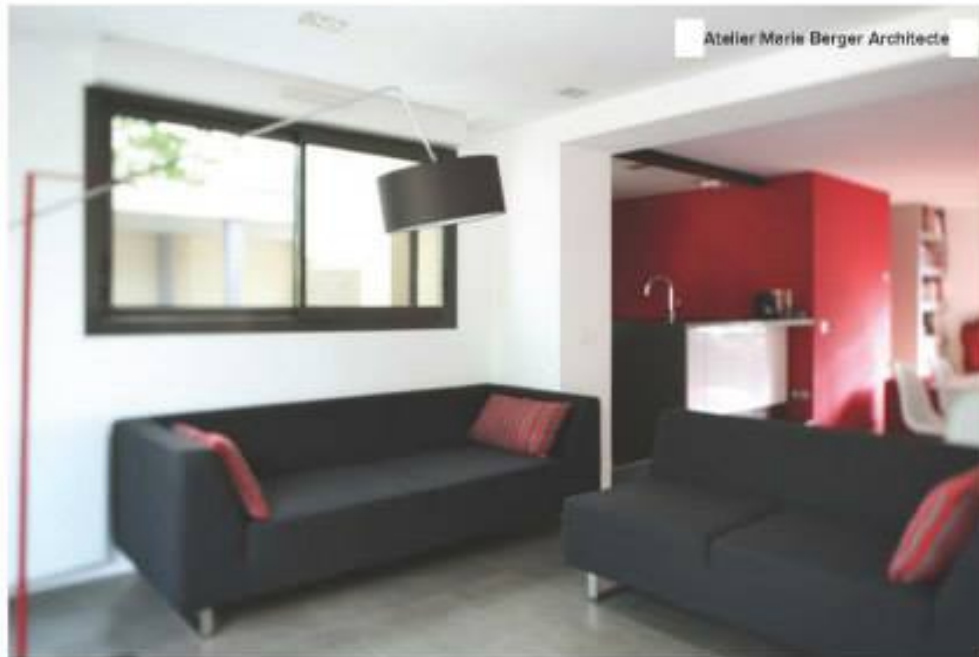
Atelier Marie Berger Architecte

À la fois architecte DPLG et designer d'espace, Marie Berger a imaginé ce superbe salon au rez-de-chaussée d'une maison individuelle des années 50, qu'elle a entièrement réhabilitée. « Je n'ai gardé que le mur et la toiture. Sinon j'ai tout démolli et reconstruit pour que le rez-de-chaussée soit traversant. Pour qu'il soit baigné d'une belle lumière naturelle. » Intégré à la pièce à vivre, le salon donne sur le jardin grâce à de grandes baies vitrées. Et il a été aménagé, meublé et décoré a minima , pour conserver une véritable sensation d'espace, selon un code couleur simplifié. À base de blanc, de gris et de rouge.