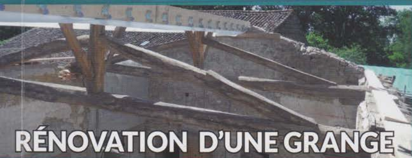
RÉNOVATION D'UNE GRANGE