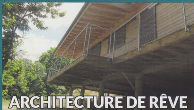
ARCHITECTURE DE RÊVE